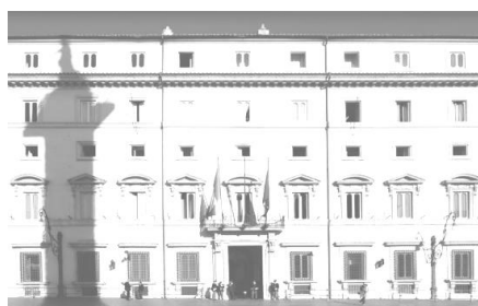
Governo - Ministero della Giustizia