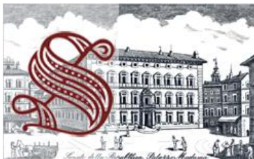
Senato della Repubblica »